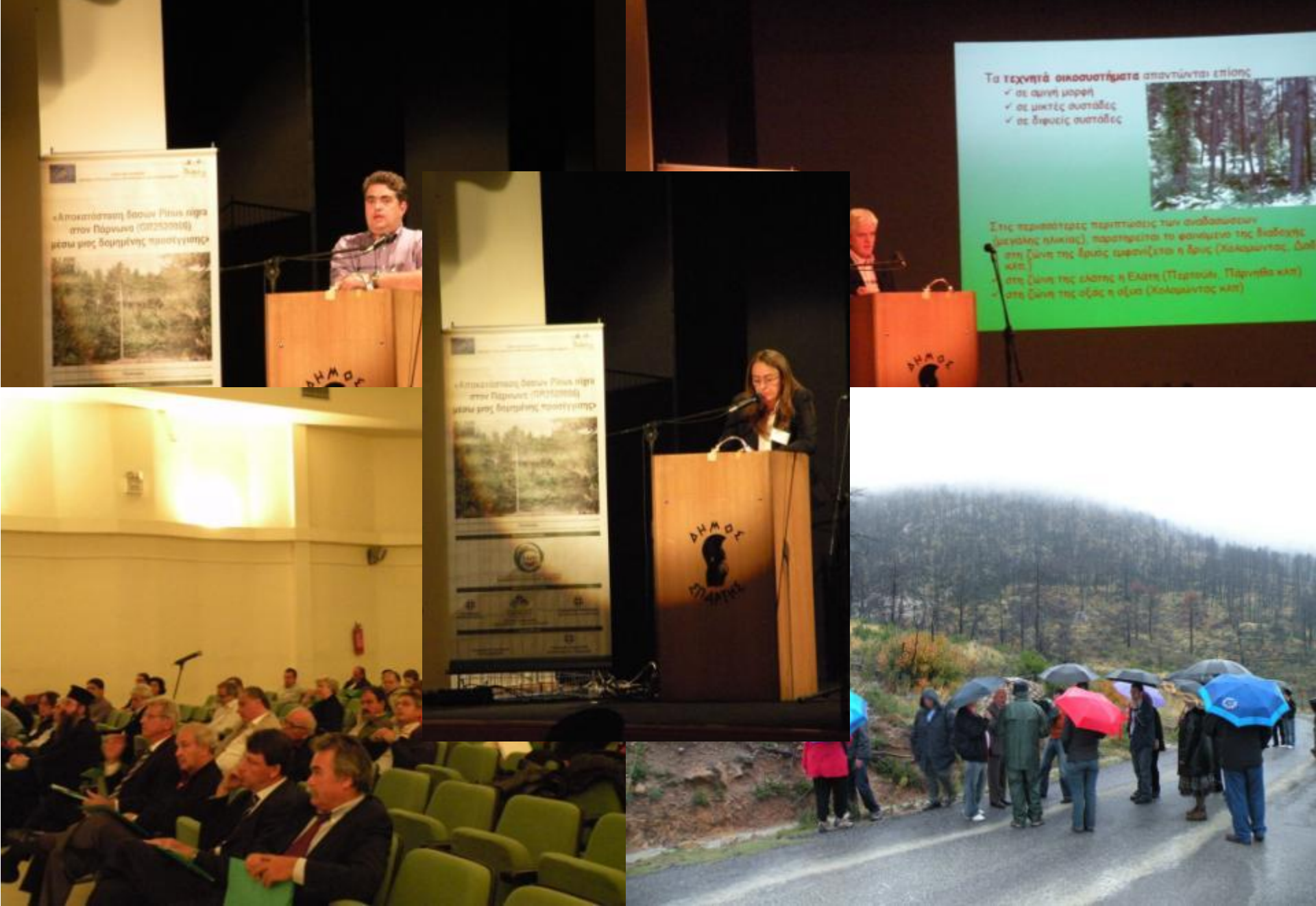
LIFE07 NAT/GR/000286 PINUS «Αποκατάσταση των δασών Pinus nigra στον Πάρνωνα (GR2520006) μέσω μιας δομημένης προσέγγισης»